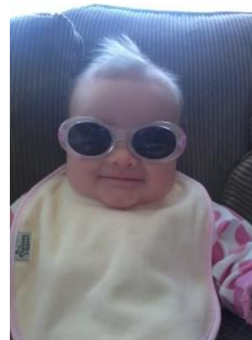
Y to nesaf

Mae gan y Corpws newydd y potensial i newid, nid dim ond cynnwys cyrsiau Cymraeg, ond hefyd y ffordd mae'r iaith yn cael ei dysgu. Bydd rhestrau amledd yn galluogi blaenoriaethu'r geiriau ac ymadroddion mwyaf eu defnydd a'r rhai mwyaf defnyddiol. Gellir datblygu cyrsiau fydd yn targedu grwpiau oedran arbennig, grwpiau cymdeithasol, gweithfeydd ac ardaloedd daearyddol arbennig, ar sail ymchwil fanwl gywir, a gall dysgwyr weld sut y defnyddir geiriau yn y cyd-destun cywir. Bydd y gallu i greu cyrsiau ar sail yr iaith lafar a ddefnyddir, yn hytrach na cheisio dyfalu'r hyn a ddefnyddir, yn gam enfawr ymlaen ym myd Dysgu Cymraeg i Oedolion. Bydd y Corpws yn adnodd gwych ar gyfer dylunwyr cyrsiau, ymchwilwyr, tiwtoriaid a dysgwyr. Ond ar ben hynny i gyd, pan glywaf ryw ben bach hunanbwysig yn dweud, "So ni'n gweud e fel 'ny", gallaf ddweud, "Ydych" a phrofi'r peth. Dyna beth yw cynnydd!